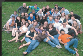
CCO National Staff